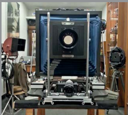
La Gibellini 16x20" sotto all'obiettivo si intravede Nikon F!