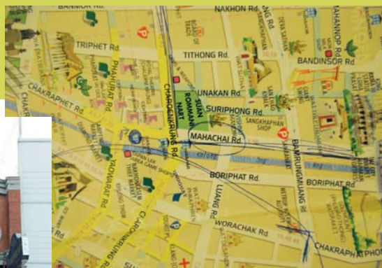
Particolare della mappa di Chinatown.