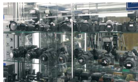
Particolare di uno dei tanti piccoli negozi situato nella palazzina di Chinatown.