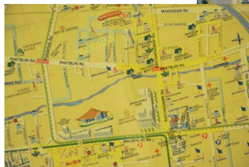
Mappa del centro commerciale Computer City.