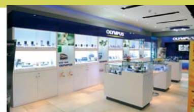
Showroom Olympus situato in MBK.