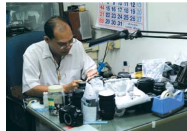
Un riparatore di fotocamere al lavoro in Chinatown.