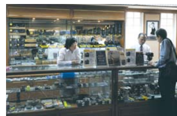
Un tecnico Nikon sta spiegando una fotocamera digitale.