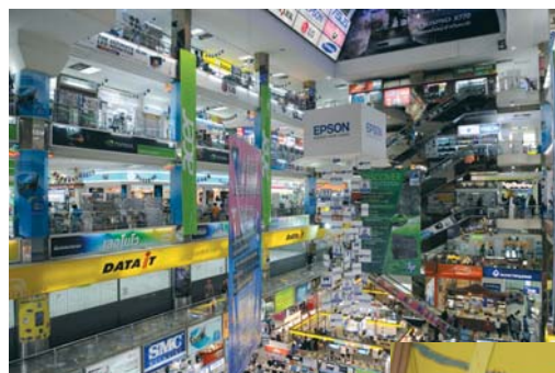
Interno del grande centro commerciale "Computer City" situato a Bangkok.