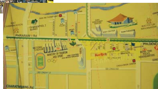
Particolare della mappa del centro commerciale MBK a Bangkok.