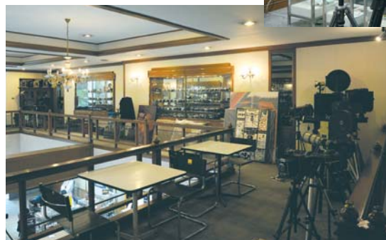
Una parte del museo situata al primo piano dello showroom Nikon.