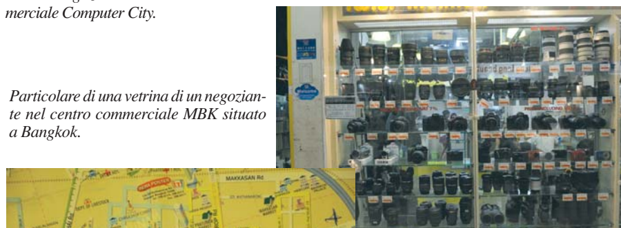
Particolare di una vetrina di un negoziante nel centro commerciale MBK situato a Bangkok.