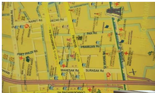
Particolare della mappa dello showroom Nikon.