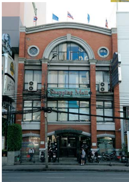
Entrata della palazzina a Bangkok in zona Chinatown, dove viene venduto l'usato.

È uno dei punti vendita della catena Sunny, un elegantissimo palazzo posizionato in Silom Road 132. All'entrata una vetrata di cristallo, con il marchio Nikon sulla destra e gli altri trattati sulla sinistra. Il personale è impeccabile, pronto a risolvere qualsiasi richiesta del cliente.