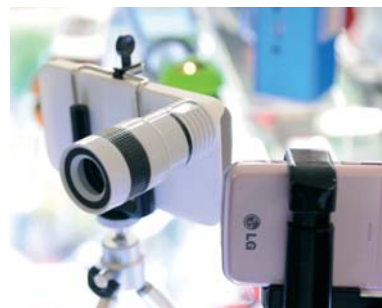
Piccolo teleobiettivo per cellulari, negozio situato in MBK.