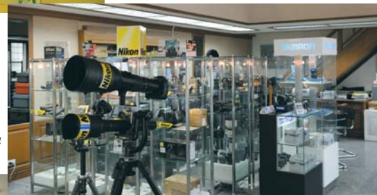
Interno dello showroom Nikon a Bangkok.